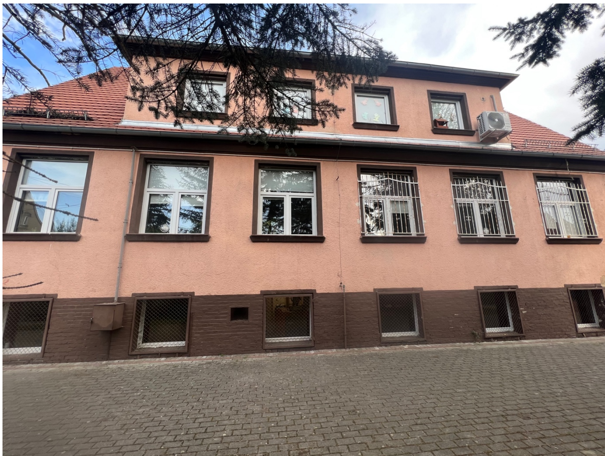
Fot. Obszar opracowania – widok ogólny.