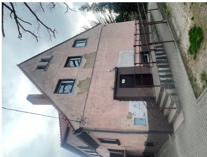
Fot. Obszar opracowania – widok ogólny.