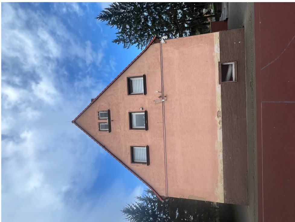
Fot. Obszar opracowania – widok ogólny.