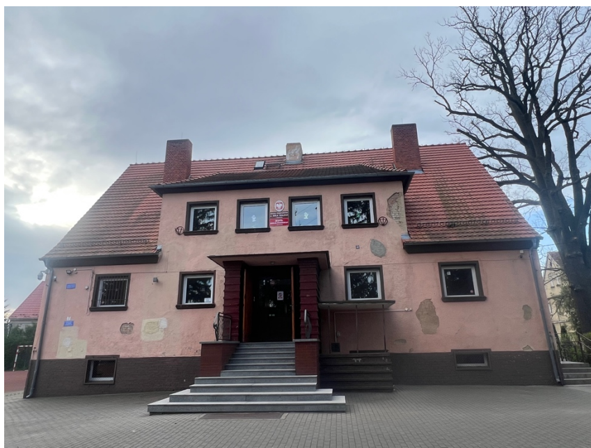
Fot. Obszar opracowania – widok ogólny.